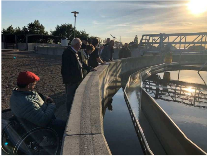
Rundvisning Stege Rensningsanlæg